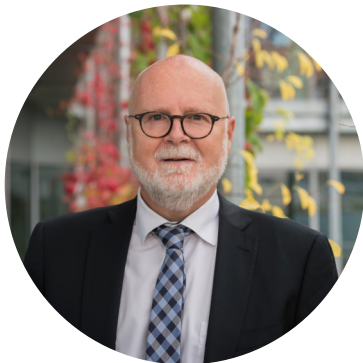
Alain Régnier , préfet, délégué interministériel

« Depuis deux ans et demi, je m'emploie avec mon équipe et tous nos partenaires à mettre en œuvre la stratégie nationale d'accueil et d'intégration des réfugiés. Partir des projets des personnes, s'inscrire dans un territoire, s'appuyer sur l'engagement citoyen sont des facteurs clés de cette politique.